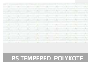
RS TEMPERED POLYKOTE