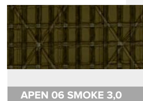
APEN 06 SMOKE 3,0