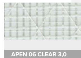
APEN 06 CLEAR 3,0

APEN 06 OD tiene una película de 3,0 mil de grosor y está diseñada para aplicaciones en monotipos como el nuevo catamarán olímpico Nacra 17. El acabado está disponible en diversos colores.