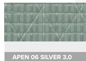
APEN 06 SILVER 3,0